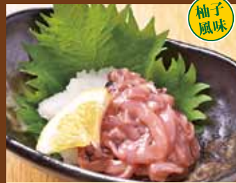
いかの塩辛 380円(税込418円)