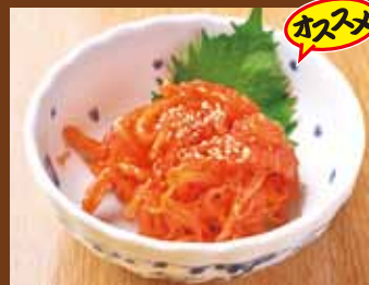
するめいかキムチ 380円(税込418円)