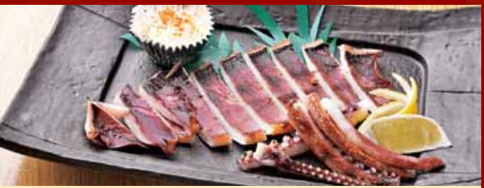
いかの一夜干し 550円 (税込605円)