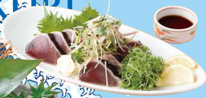
薫焼きかつおタタキ 880円 (税込968円)