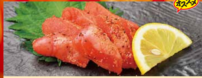
炙り明太子 550円 (税込605円) オススメ