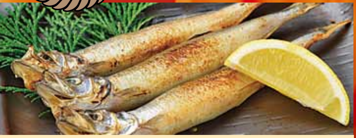
ししゃも 380円 (税込418円)