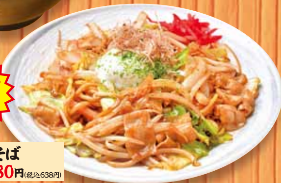
新世界焼きそば 580円(税込638円)