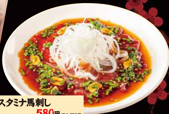
スタミナ馬刺し 580円(税込638円)