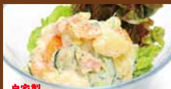
自家製 ポテトサラダ 350円(税込385円)