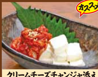
クリームチーズチャンジャ添え 380円(税込418円)