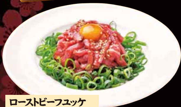
ローストビーフステーキ 700円(税込770円)