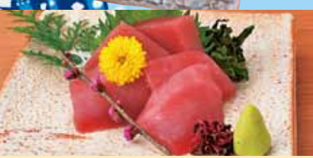
まぐろ造り 580円 (税込638円)