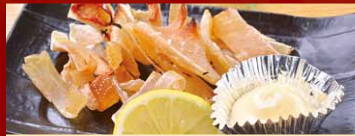
エイヒレ炙り 480円 (税込528円)