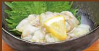
たこわさび 350円(税込385円)