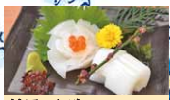
紋甲いか造り 580円 (税込638円)