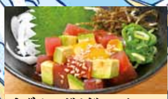
まぐろアボガドユッケ 550円 (税込605円)