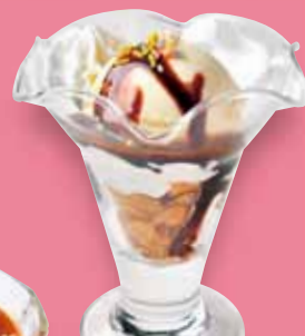
バニラアイス 380円(税込418円)