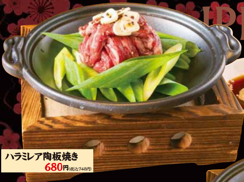
ハラミア陶板焼き 680円(税込748円)