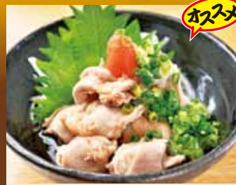
鶏ハラミポン酢 380円(税込418円)