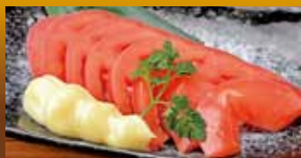
トマトスライス 320円(税込352円)