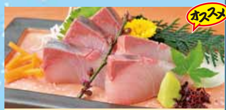
カンパチ造り 580円 (税込638円) オススメ