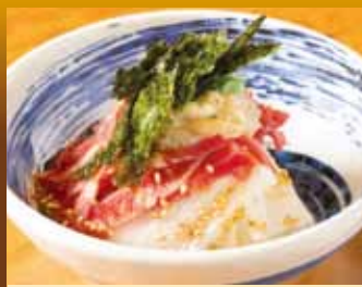
牛タン短冊 380円(税込418円)