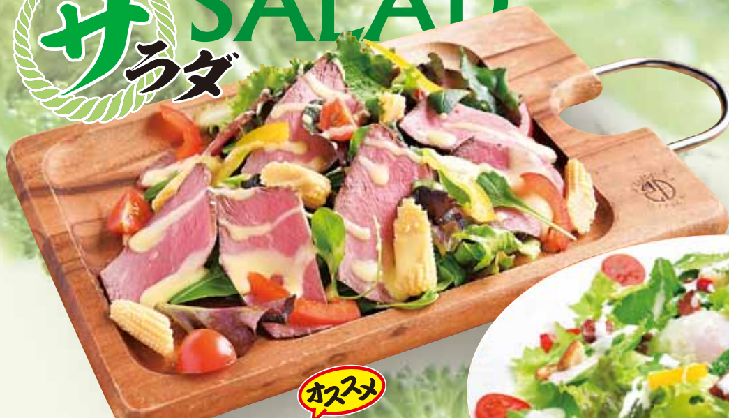
ローストビーフサラダ 780円(税込858円)