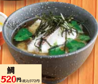
お茶漬け 鯛 520円(税込572円)