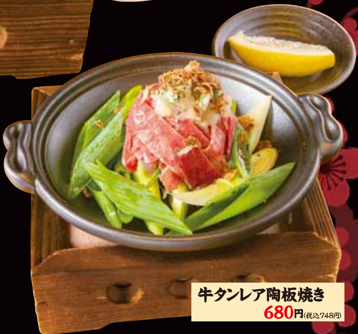
牛タンレア陶板焼き 680円(税込748円)