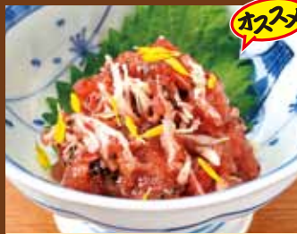
ささみ梅くらげ 380円(税込418円)