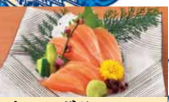
サーモン造り 580円 (税込638円)