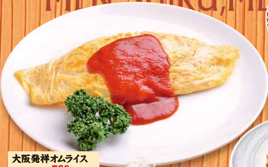
大阪発祥オムライス 580円(税込638円)