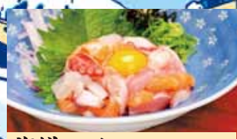
海鮮ユッケ 500円 (税込550円)