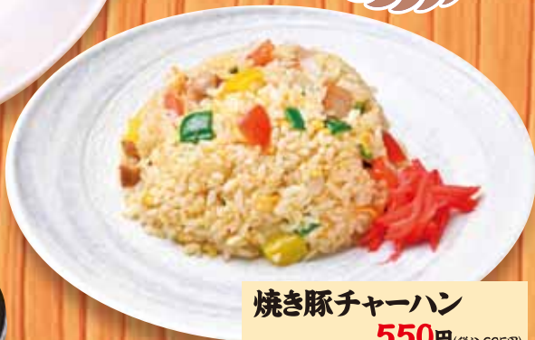
焼き豚チャーハン 550円(税込605円)