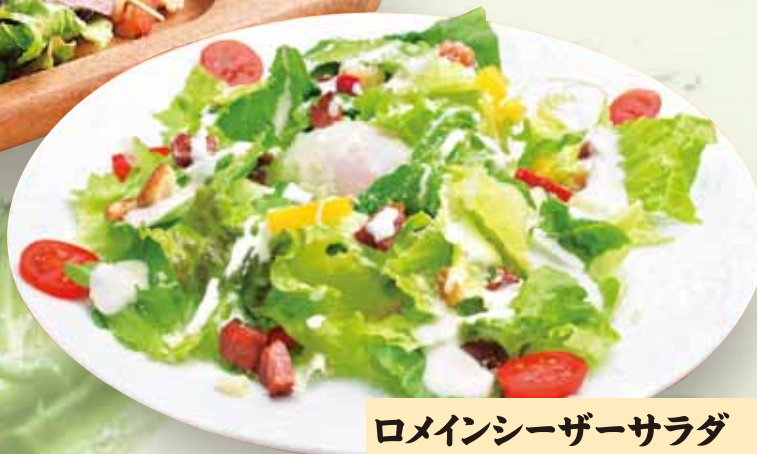
ロメインシーザーサラダ 620円(税込682円)