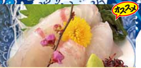
鯛造り 580円 (税込638円) オススメ