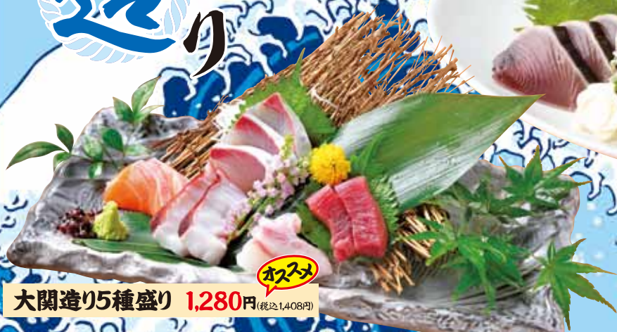
大関造り5種盛り 1,280円 (税込1,408円) オススメ