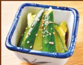
やみつき胡瓜 320円(税込352円)