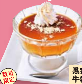
黒蜜きなこ牛乳プリン 380円(税込418円)